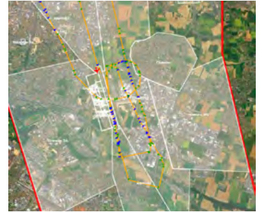
Aperçu des données livrées par le système en cours de développement.

Cyrille Boulnois, directeur de l'aéroport Lyon-Bron